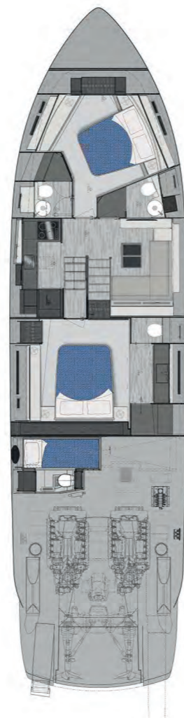
Lower Deck | 2 cabins opt layout