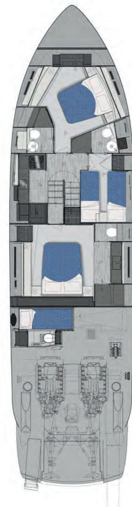
Lower Deck | 3 cabins std layout