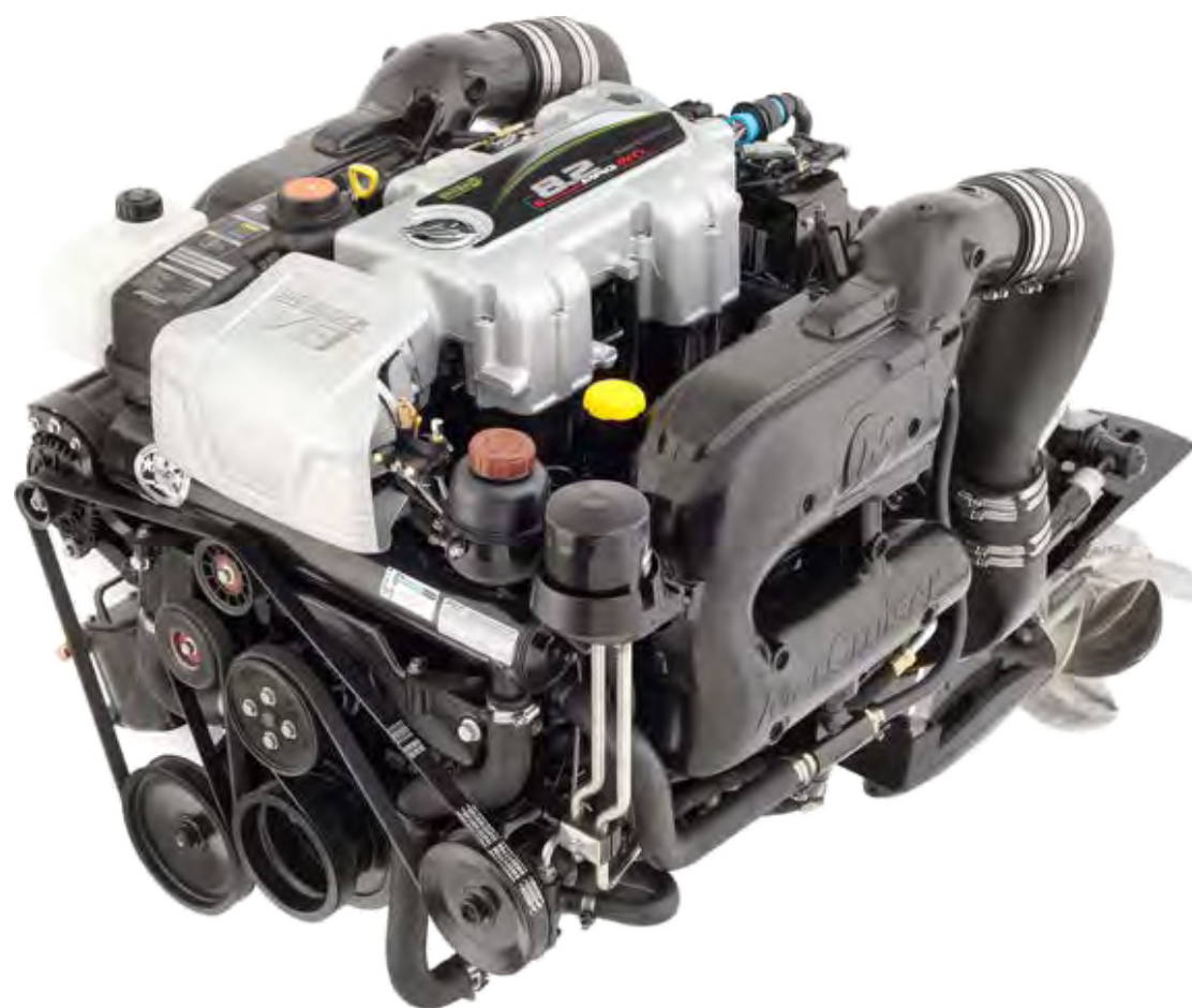
MERCURY 8.2L V8 - 430 ЛС B3 FWC DTS