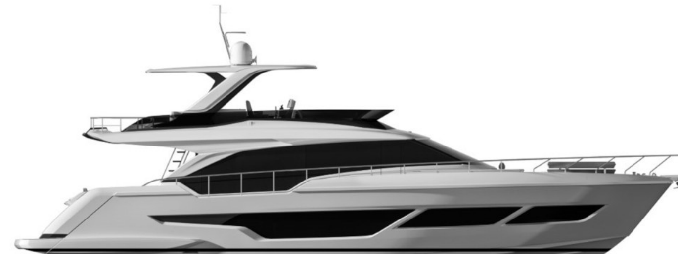
ХАРД ТОП ВЕРСИЯ