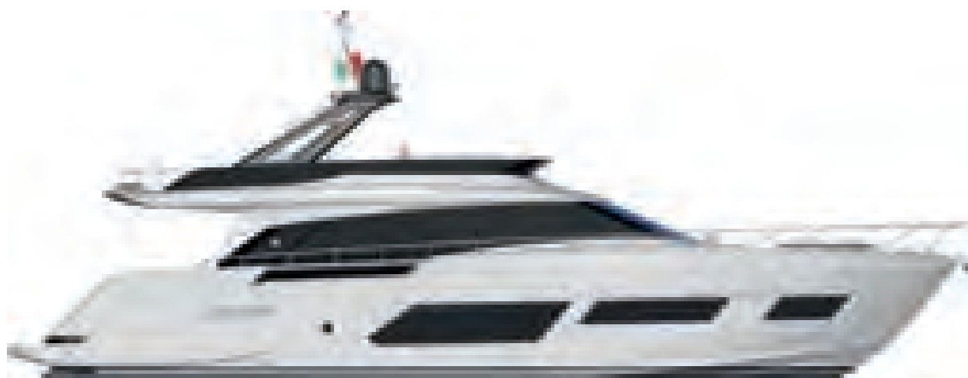
ВЕРСИЯ С АРКОЙ