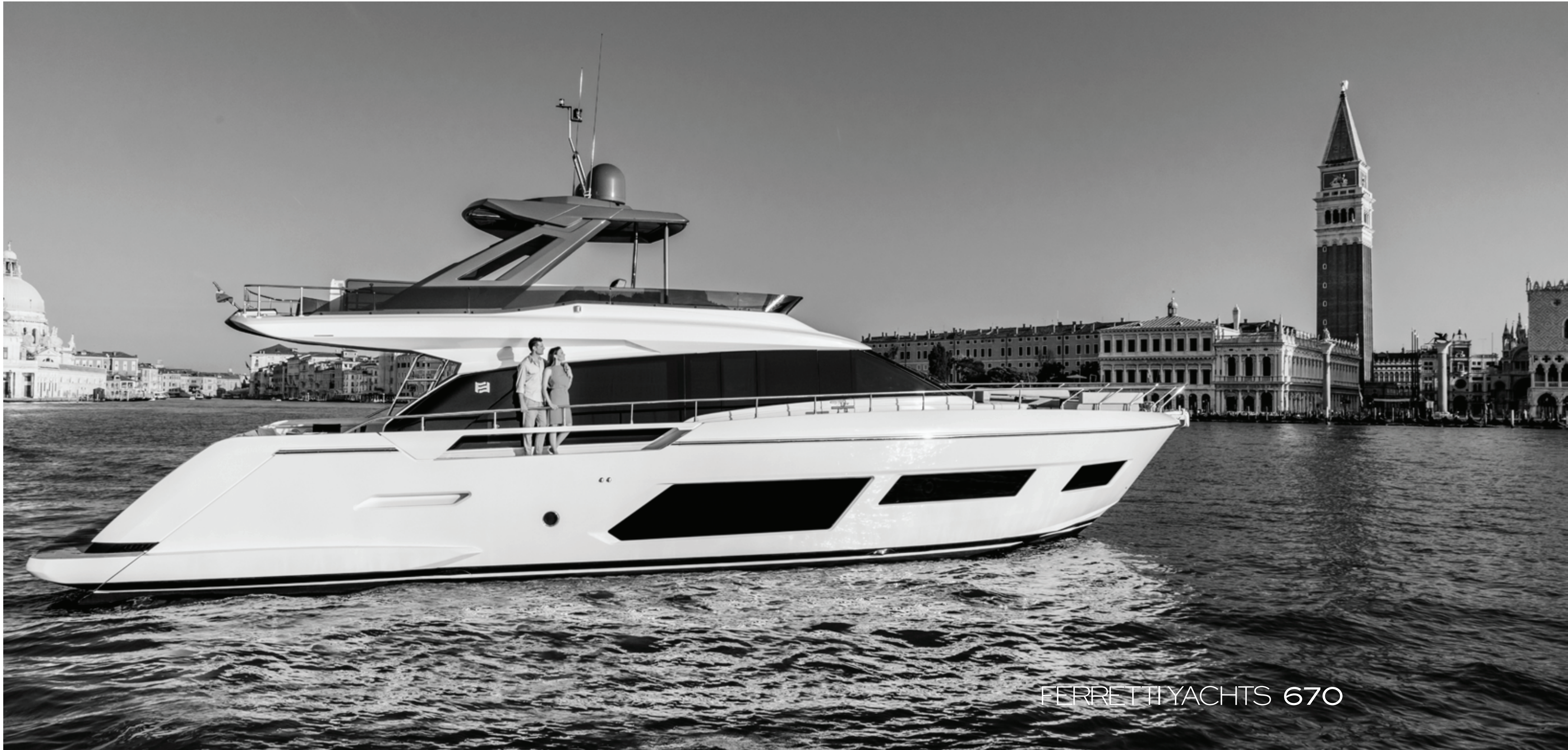
FERRETTI YACHTS 670