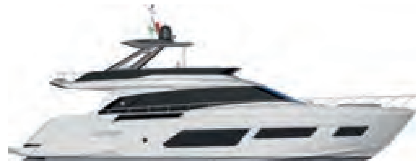
ХАРД ТОП ВЕРСИЯ